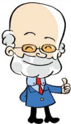
Ilustração: Caco Xavier