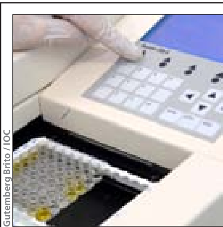
Gutemberg Brito / IOC