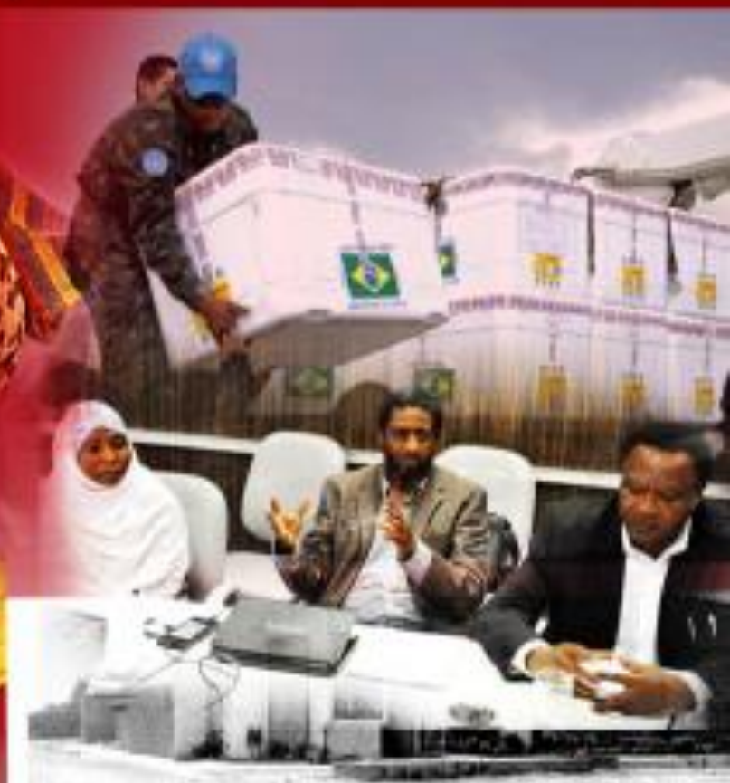
Assessoria: Colômbia de Saúde e Medicina para a África e a Europa são participantes em Florianópolis por parte de uma parceria...

Foro de discussões sobre o futuro da medicina de precisão para o enfrentamento da doença emergente